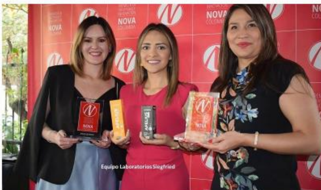
Equipo Laboratorios Siegfried

Nova Colombia, el observatorio de innovación y creatividad, comparte el listado de las innovaciones ganadoras de la primera versión de los Premios Nova, los cuales reconocen a los productos más ingeniosos, creativos y funcionales del mercado colombiano.